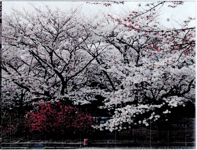
サイタ、サイタ。サクラがサイタ。（京都府立植物園）