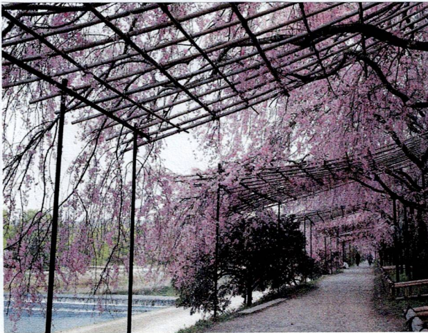
紅枝垂れ桜の並木道（半木の道）